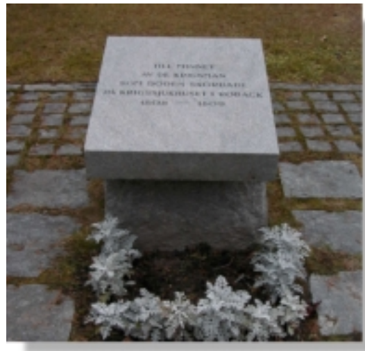
Rysstigen och ryssvärnet är andra minnen från den tiden